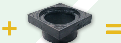
22212.334 Ø315 mm fast karm