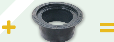
22212.234 Ø315 mm flydende karm